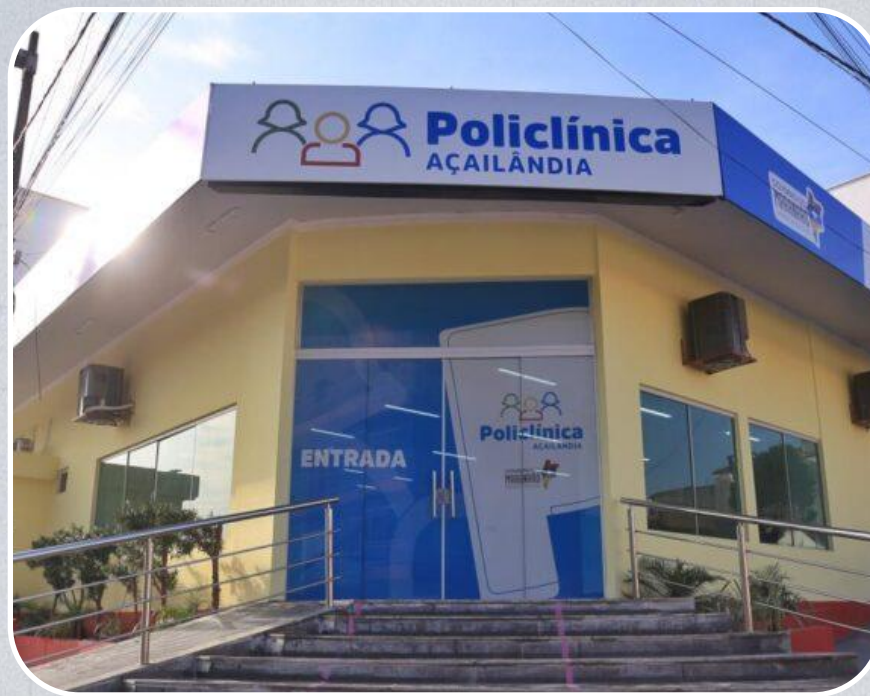
Policlínica de Açailândia