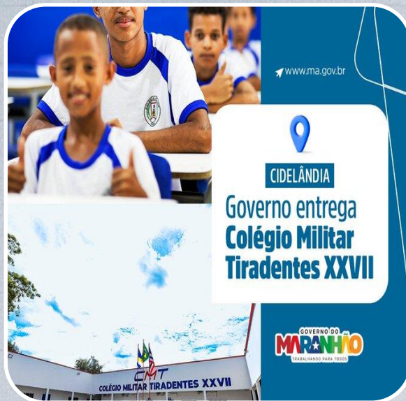
Colégio Militar Tiradentes XXVII em Cidelândia