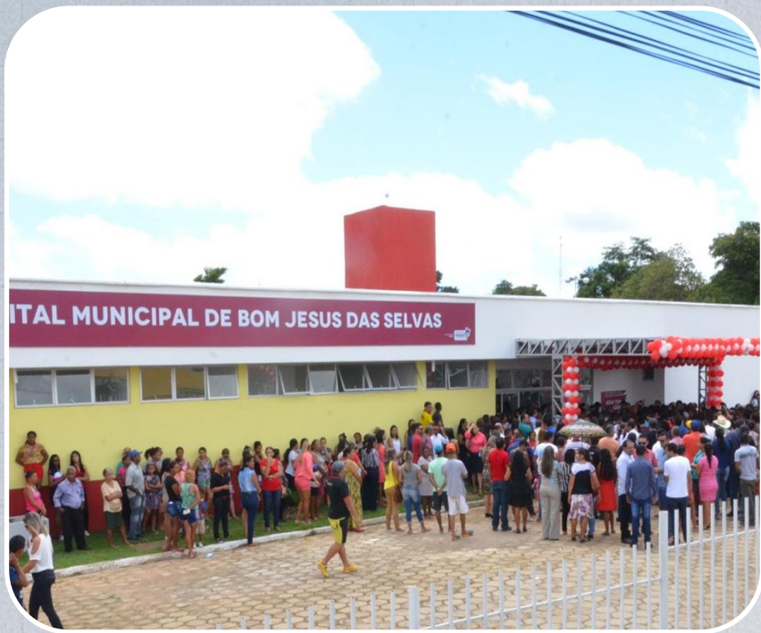
Hospital Municipal de Bom Jesus das Selvas