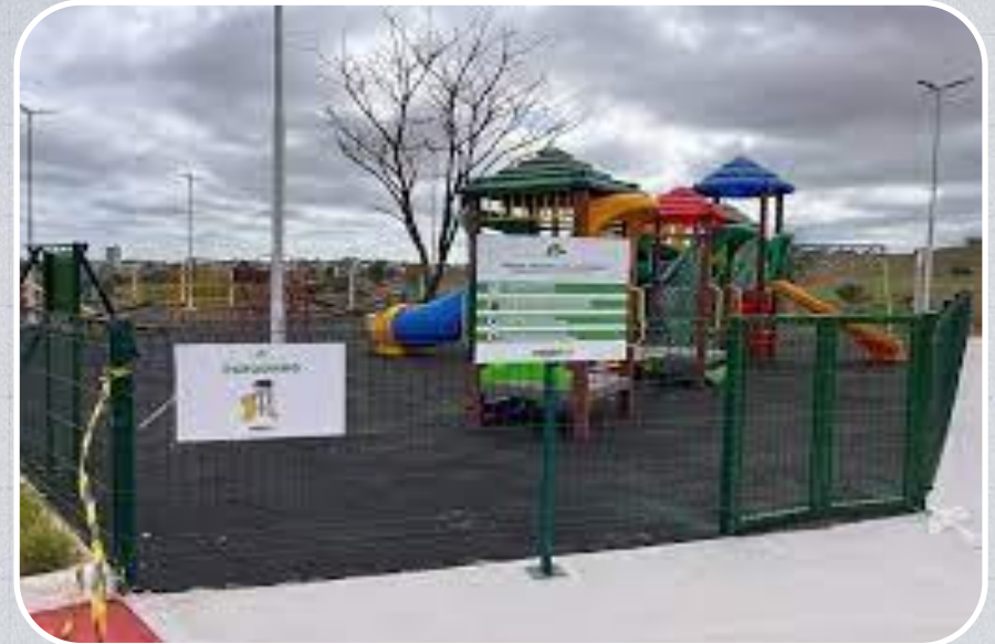
Parque ambiental de Açailândia