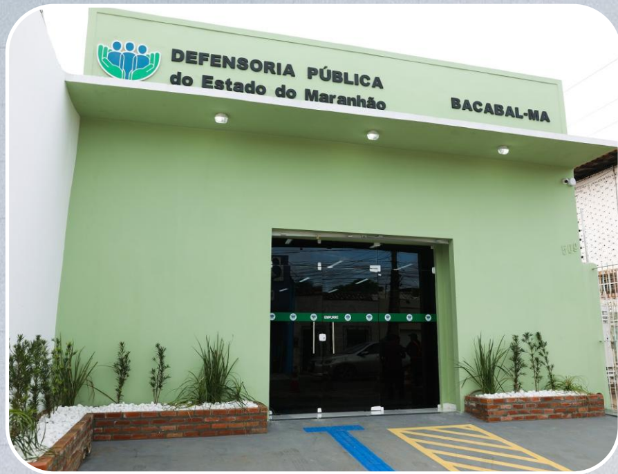
Econúcleo da DPE em Bacabal