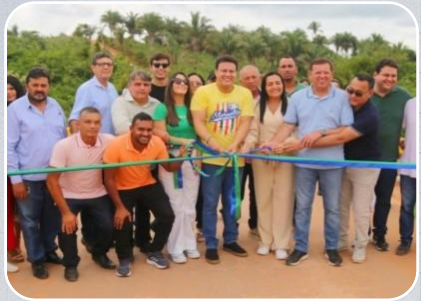
Pontes que interligam o Povoado Aldeia à sede do município de Altamira do Maranhão