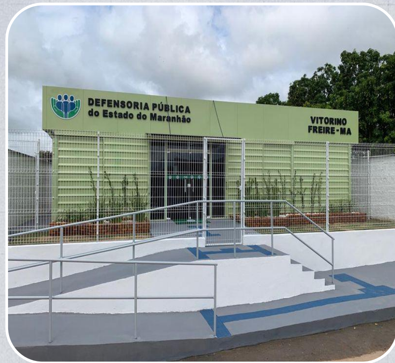
Econúcleo da DPE em Vitorino Freire