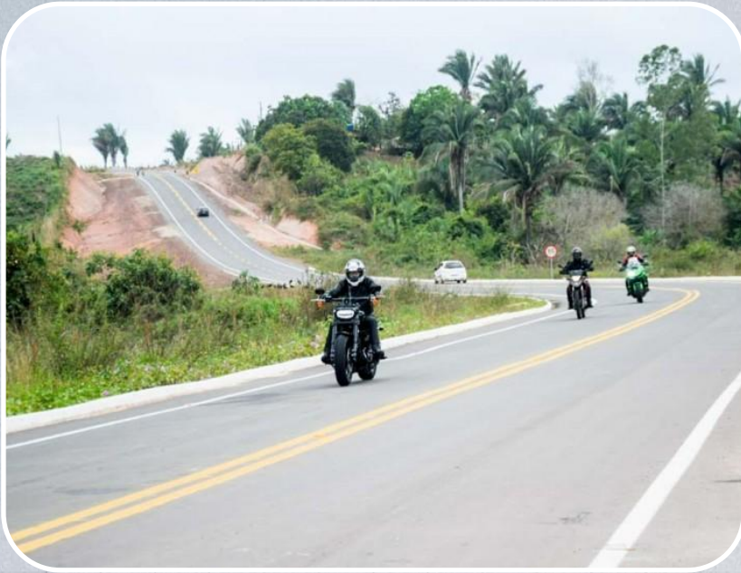
MA-119 liga Santa Luzia a Altamira