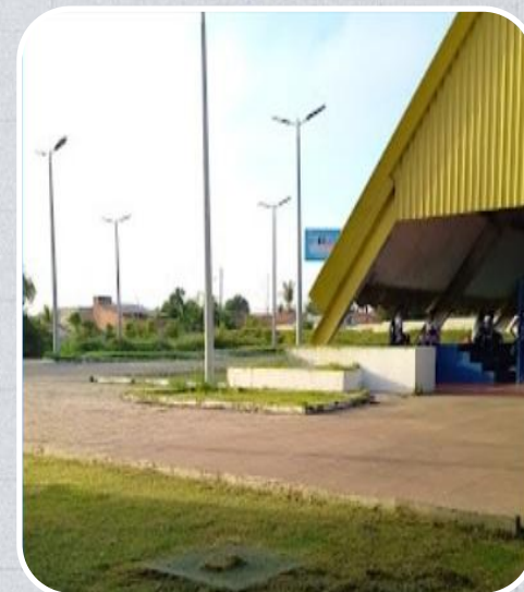
IEMA em Bacabal