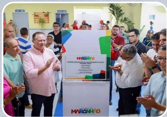
Sist. Simplificado de Abast. de Água (SSAA) Povoado Varas em Barreirinhas