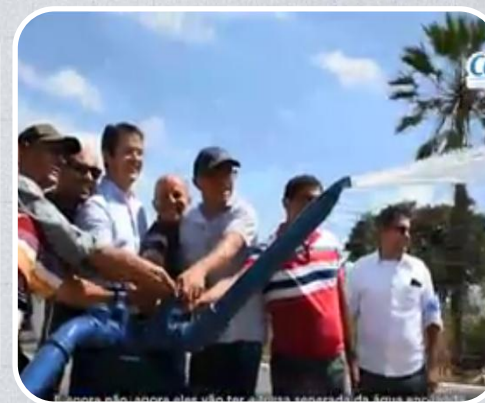
SSAA entregues nos povoados de Cidade Nova, Tapuio e São José em Barreirinhas