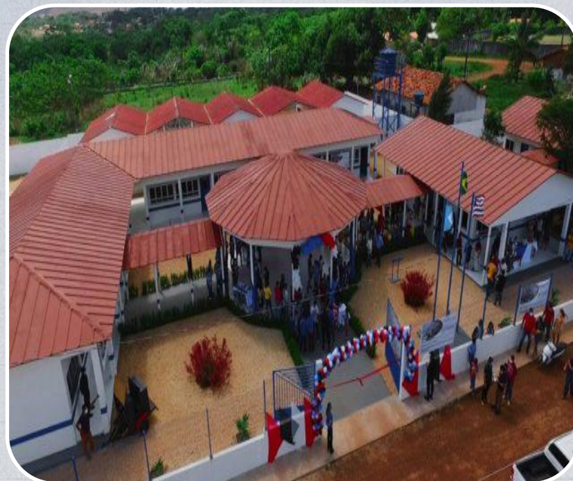
Escola Izabel Andrade no Povoado Aurizona em Godofredo Viana