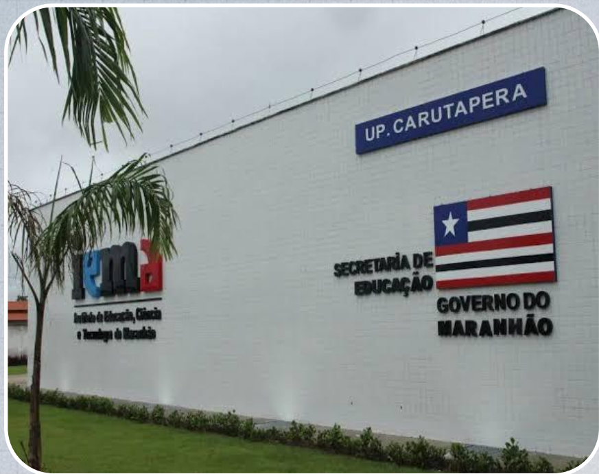
Unidade Plena do IEMA em Carutapera