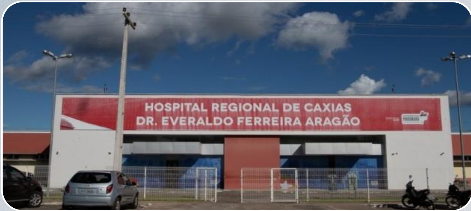
Hospital Regional de Caxias Dr. Everaldo Pereira Aragão em Caxias