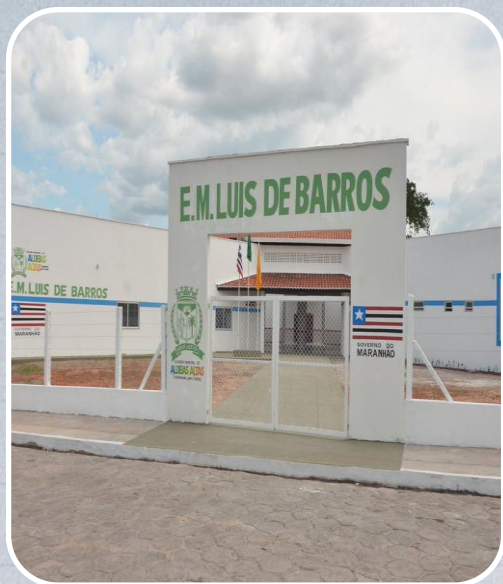
Reconstrução da E.M Luis Barros em Aldeias Altas