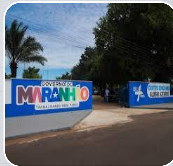
Centro Educa Mais Aluisio Azevedo em Caxias