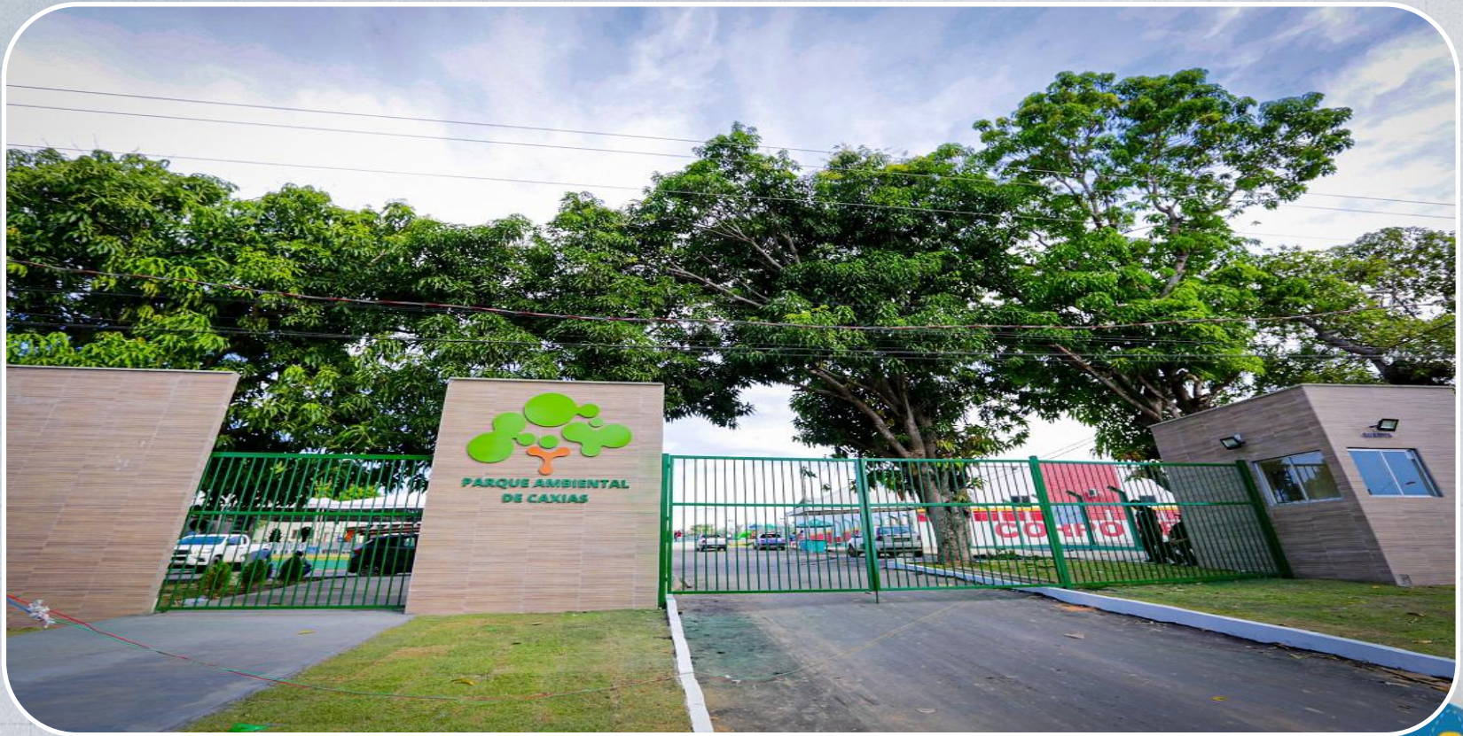
Parque ambiental de Caxias