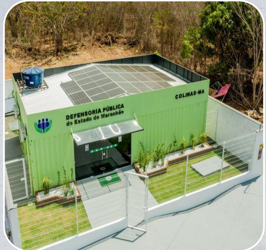
Econúcleo da DPE em Colinas