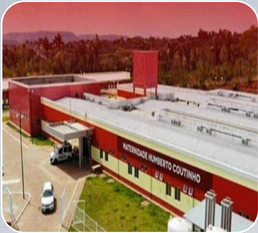
Maternidade Humberto Coutinho em Colinas