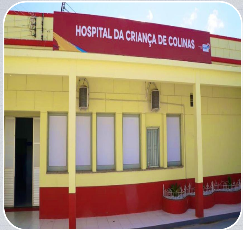
Hospital da Criança em Colinas