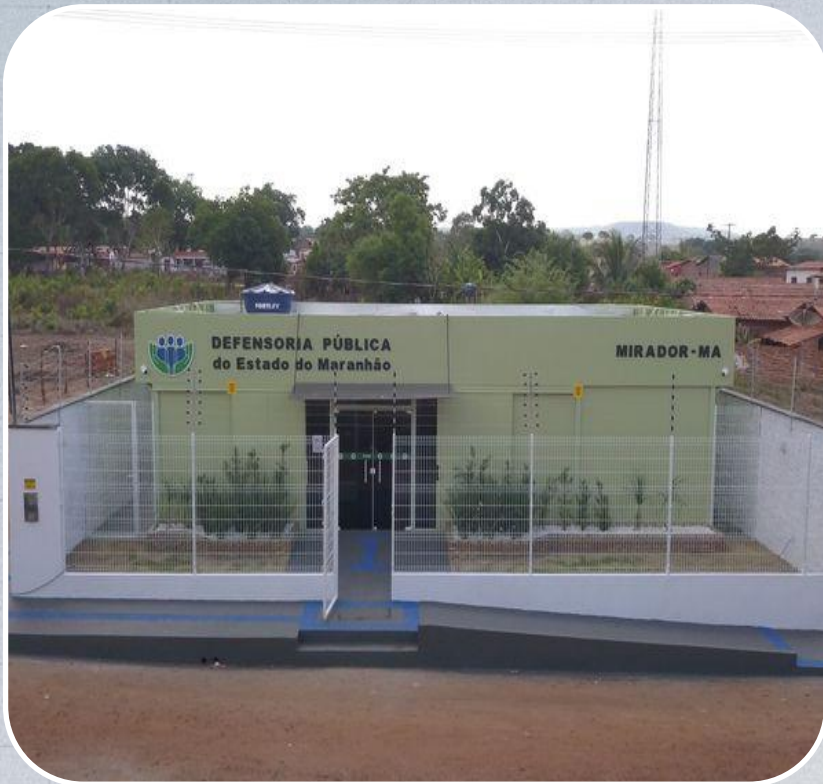
Econúcleo da DPE em Mirador