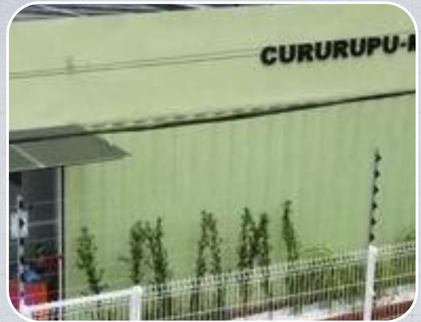
Econúcleo da DPE em Cururupu