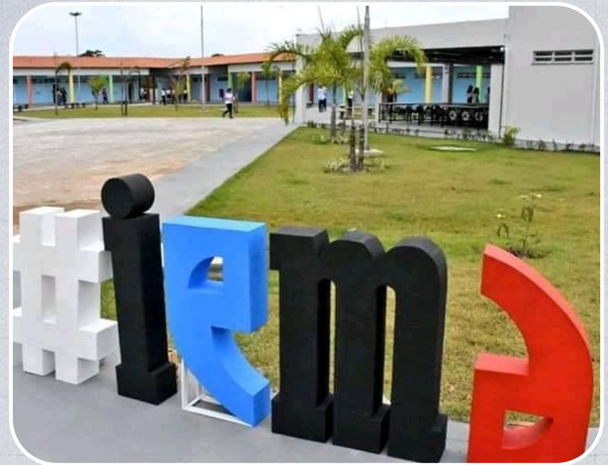
IEMA em Cururupu