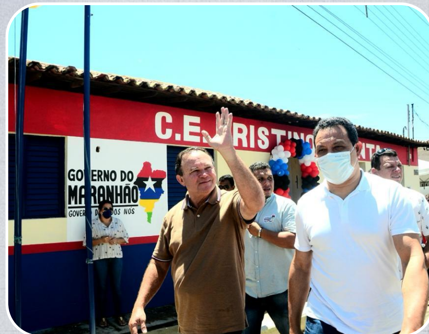
Centro de Ensino Cristino Pimenta em Bacuri