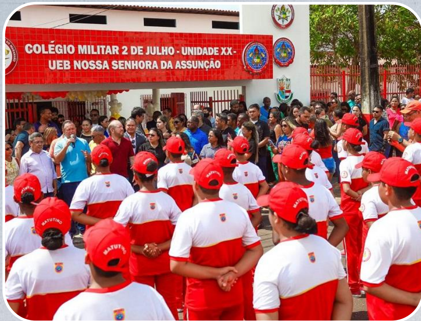
Colégio Militar 2 de julho – Unidade XX UEB Nossa Senhora da Assunção em Guimarães