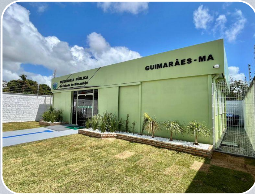
Econúcleo da DPE em Guimarães