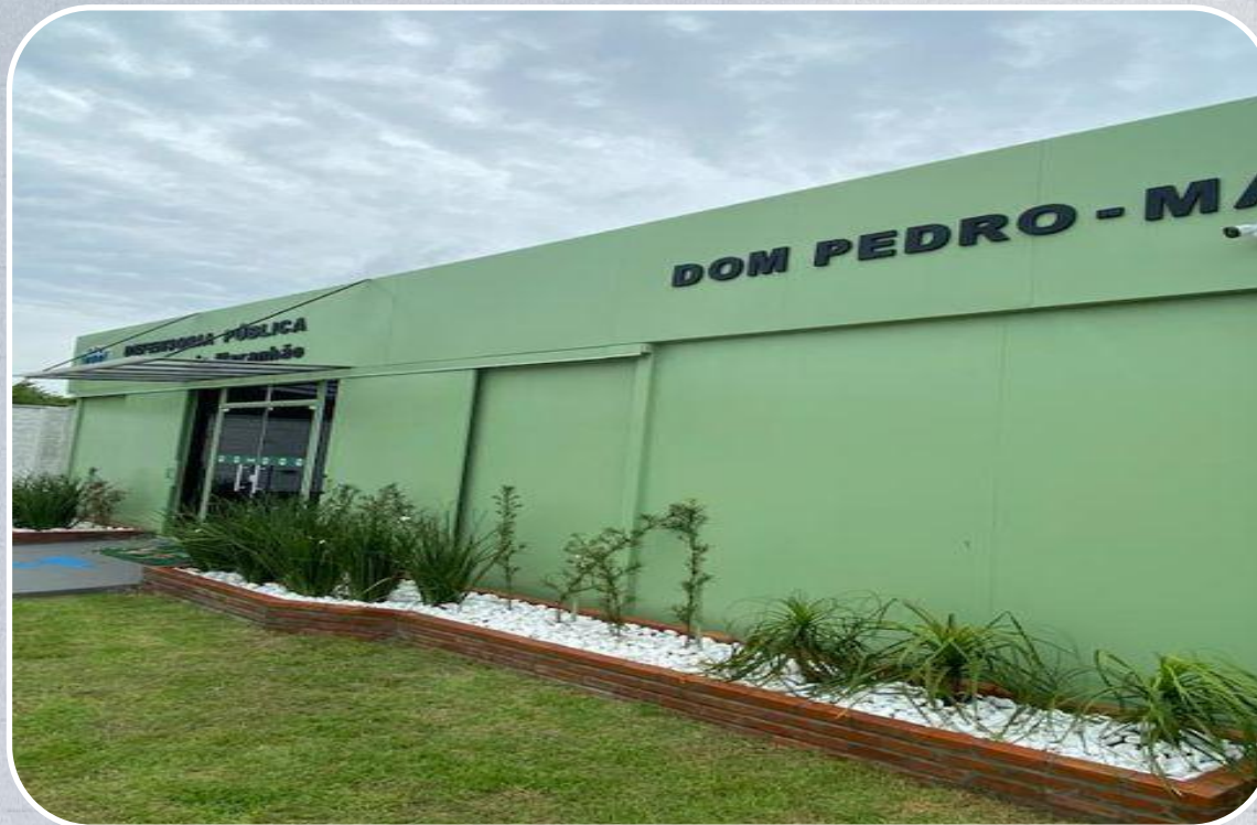
Econúcleo da DPE em Dom Pedro