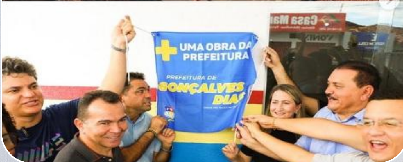
Reforma do Hospital Mun. Dr. Leônidas Lima da Silva em Gonçalves Dias