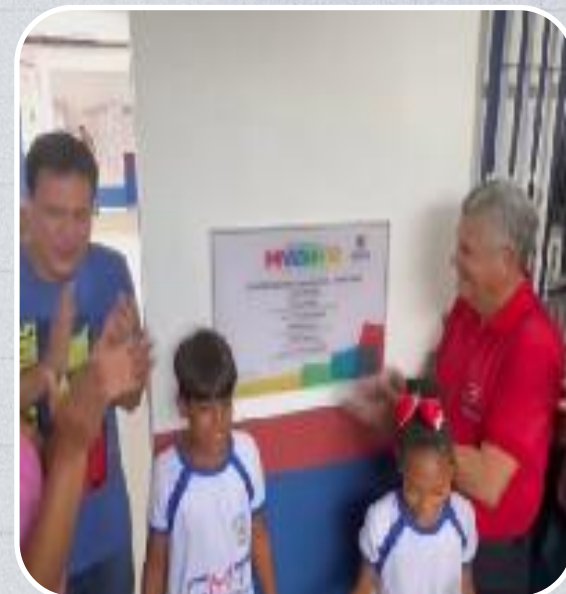
Colégio Militar Tiradentes – CMT XXXII