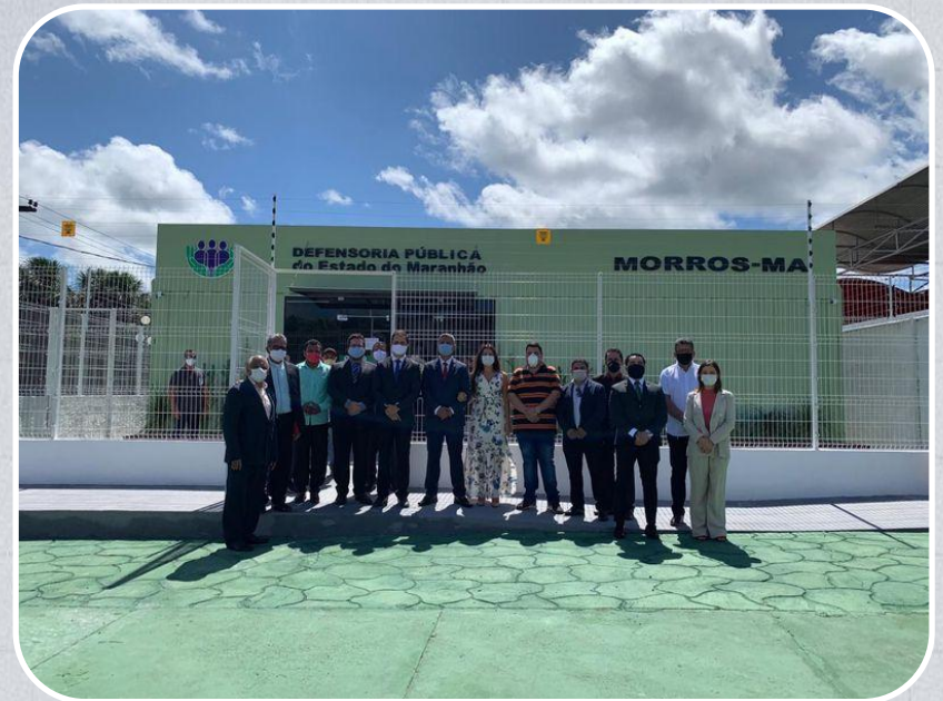
Econúcleo da DPE em Morros