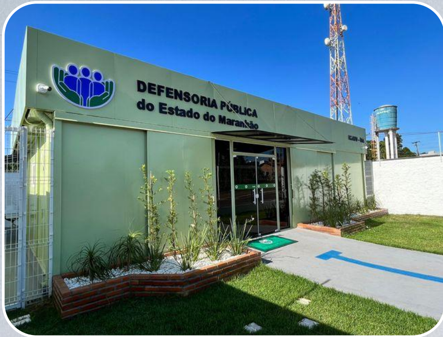
Econúcleo da DPE em Icatu