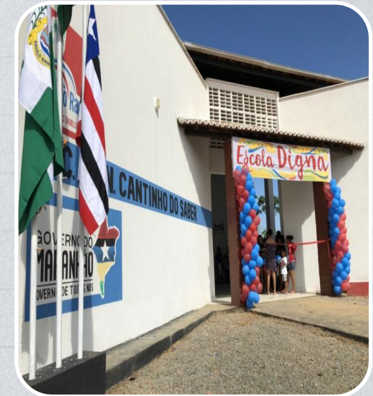
E.M. Cantinho do Saber em Paulo Ramos