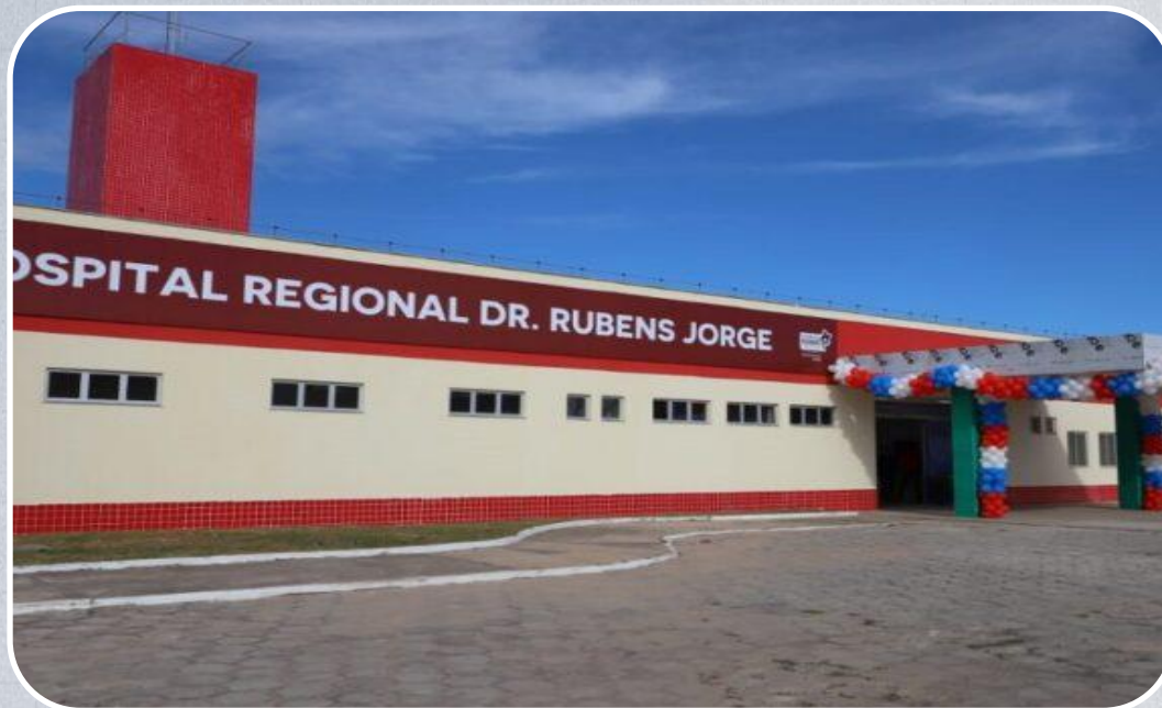
Hospital Regional Dr. Rubens Jorge em Lago da Pedra