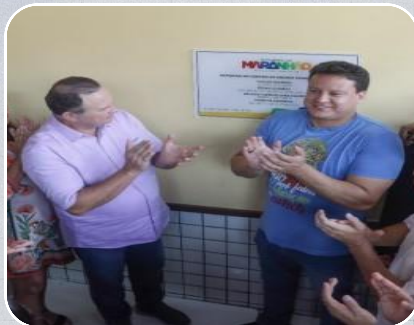
Entrega do Centro de Ensino Chagas Costa na cidade de Igarapé Grande