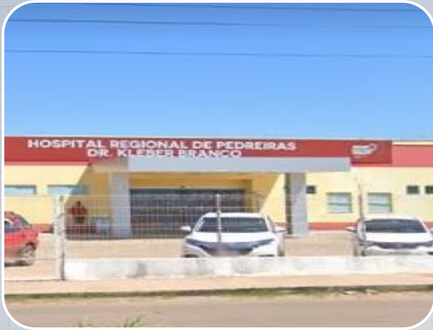
Hospital Regional Dr. Kléber Carvalho Branco em Pedreiras