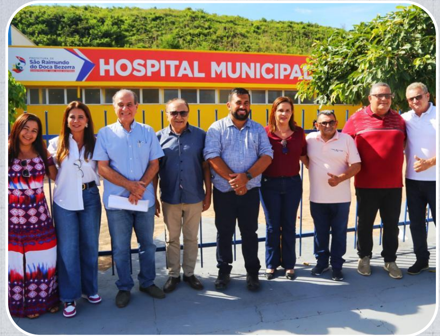
Reforma do Hospital Municipal em São Raimundo do Doca Bezerra