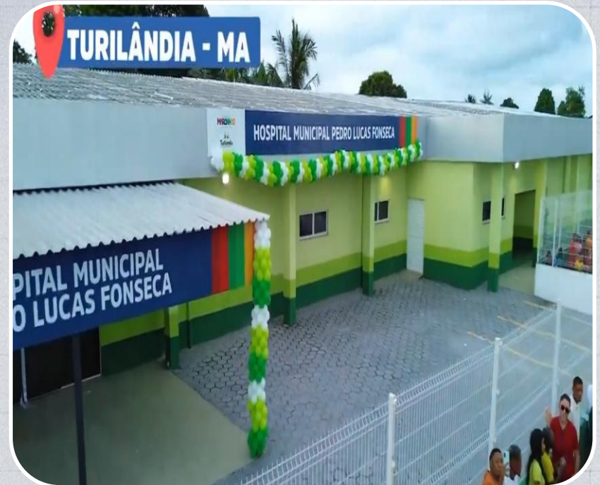
Hospital Municipal Pedro Lucas Fonseca em Turilândia