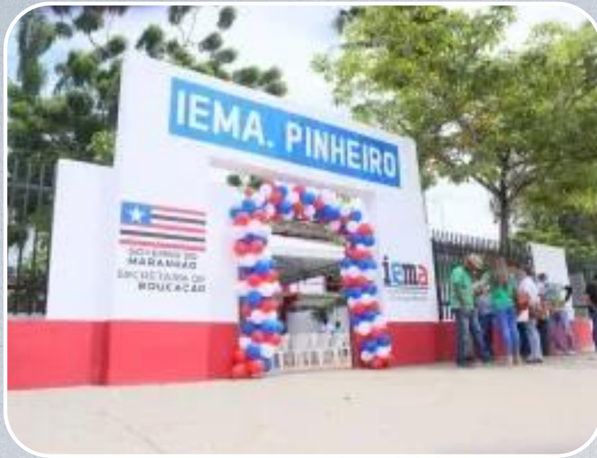
IEMA em Pinheiro