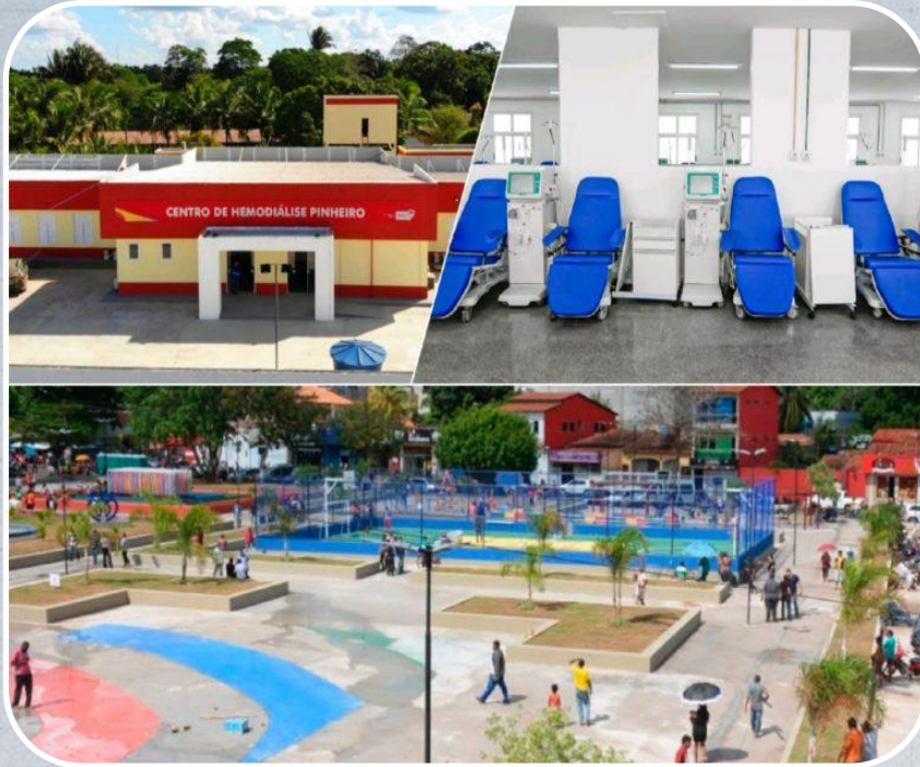
Centro de Hemodiálise em Pinheiro