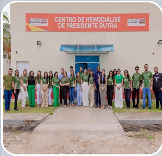
Centro de Hemodiálise de Presidente Dutra

Construção, reforma, ampliação e equipagem de hospital.