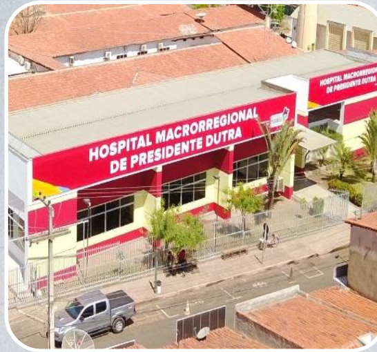
Hospital Macrorregional de Presidente Dutra