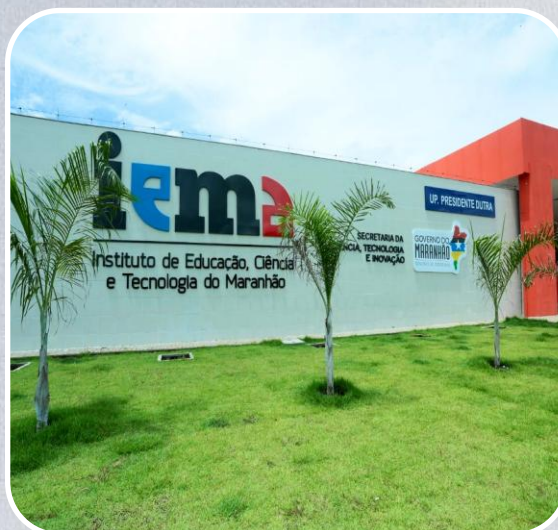
IEMA em Presidente Dutra