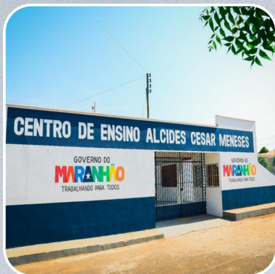
CE Alcides César Meneses em Senador Alexandre Costas