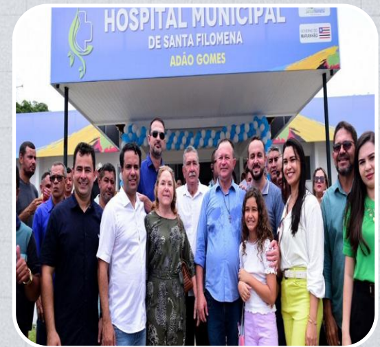
Hospital Municipal de Santa Filomena