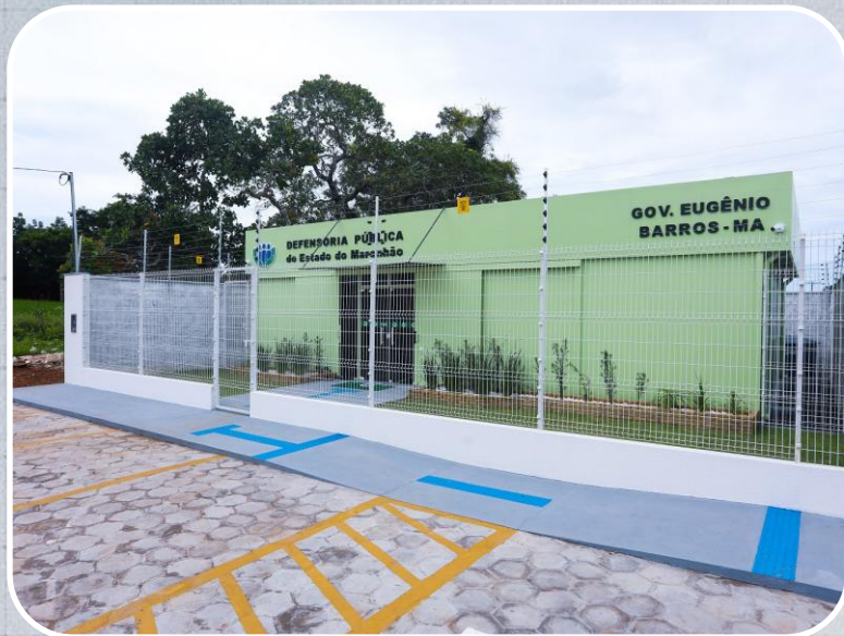
Econúcleo da DPE em Eugênio Barros