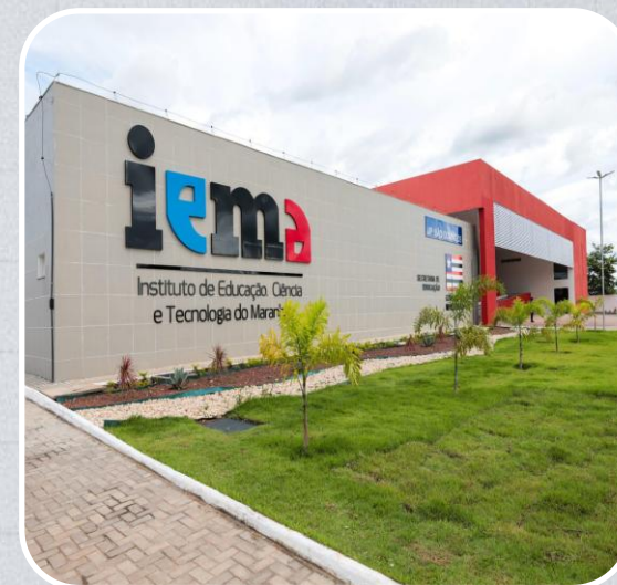
IEMA em São Domingos do Maranhão