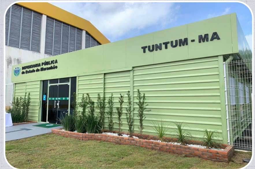
Econúcleo da DPE em Tuntum