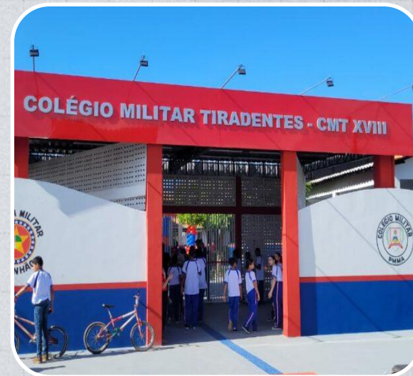
Colégio Militar Tiradentes XVIII em Pindaré