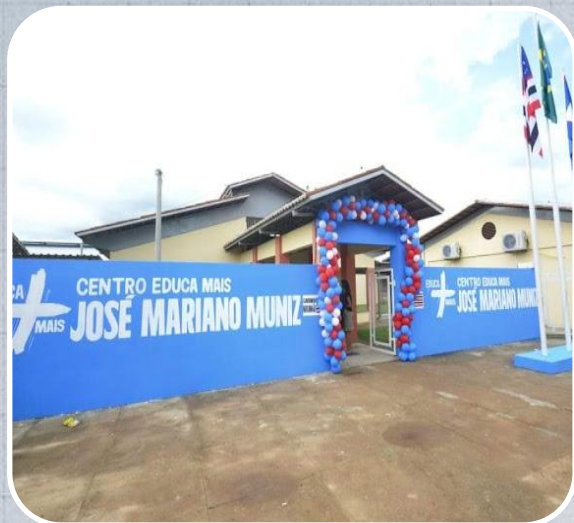
Centro Educa Mais José Mariano Muniz em Santa Luzia