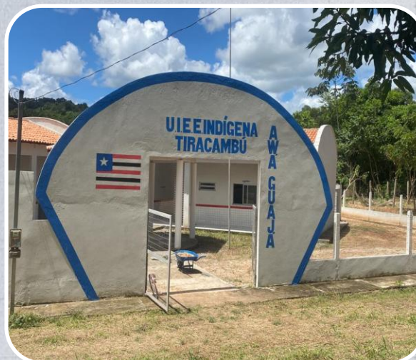
UI Educação Escolar Indígena TIRACAMBU em Bom Jardim