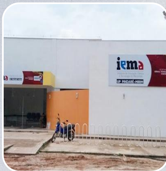
IEMA em Pindaré