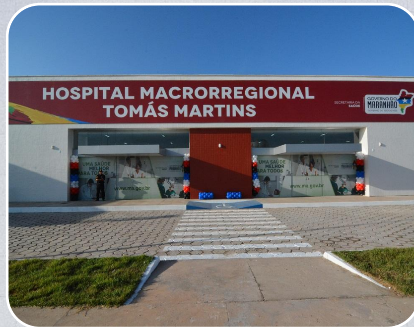
Hospital Macrorregional Tomás Martins em Santa Inês