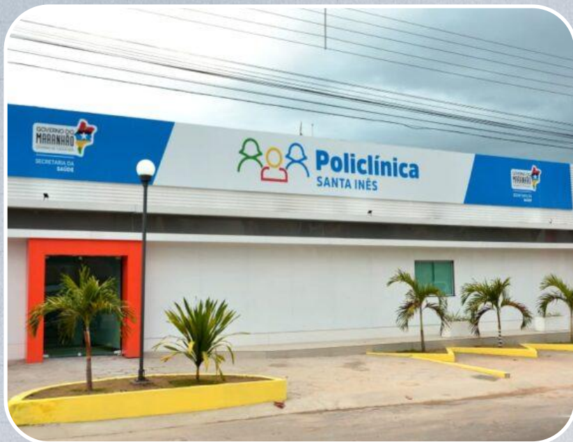
Policlínica de Santa Inês