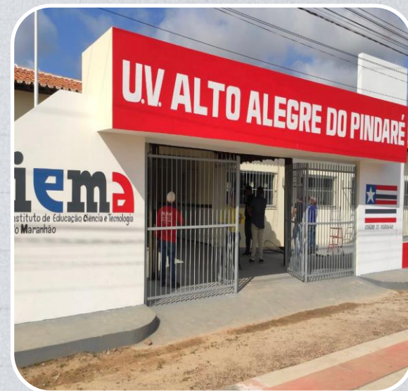
IEMA em Alto Alegre do Pindaré