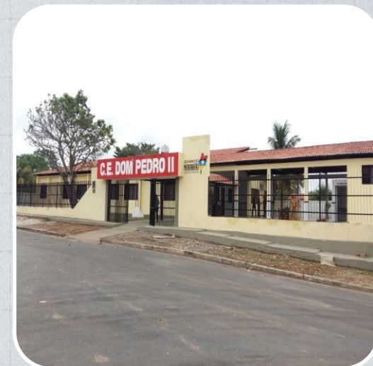
CE Dom Pedro II em Tufilândia