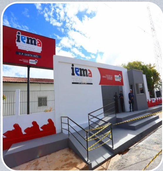
IEMA em Santa Inês