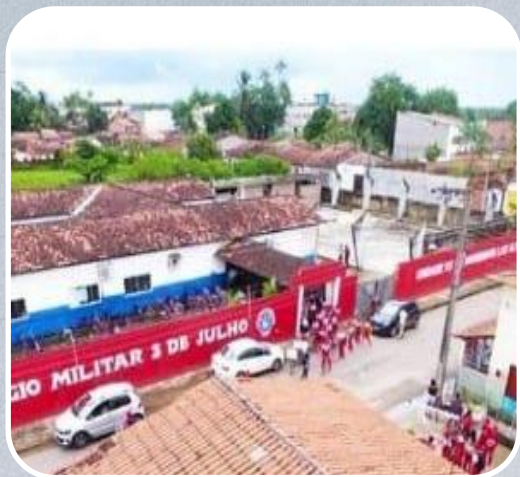
Colégio Militar 2 de Julho em Santa Inês