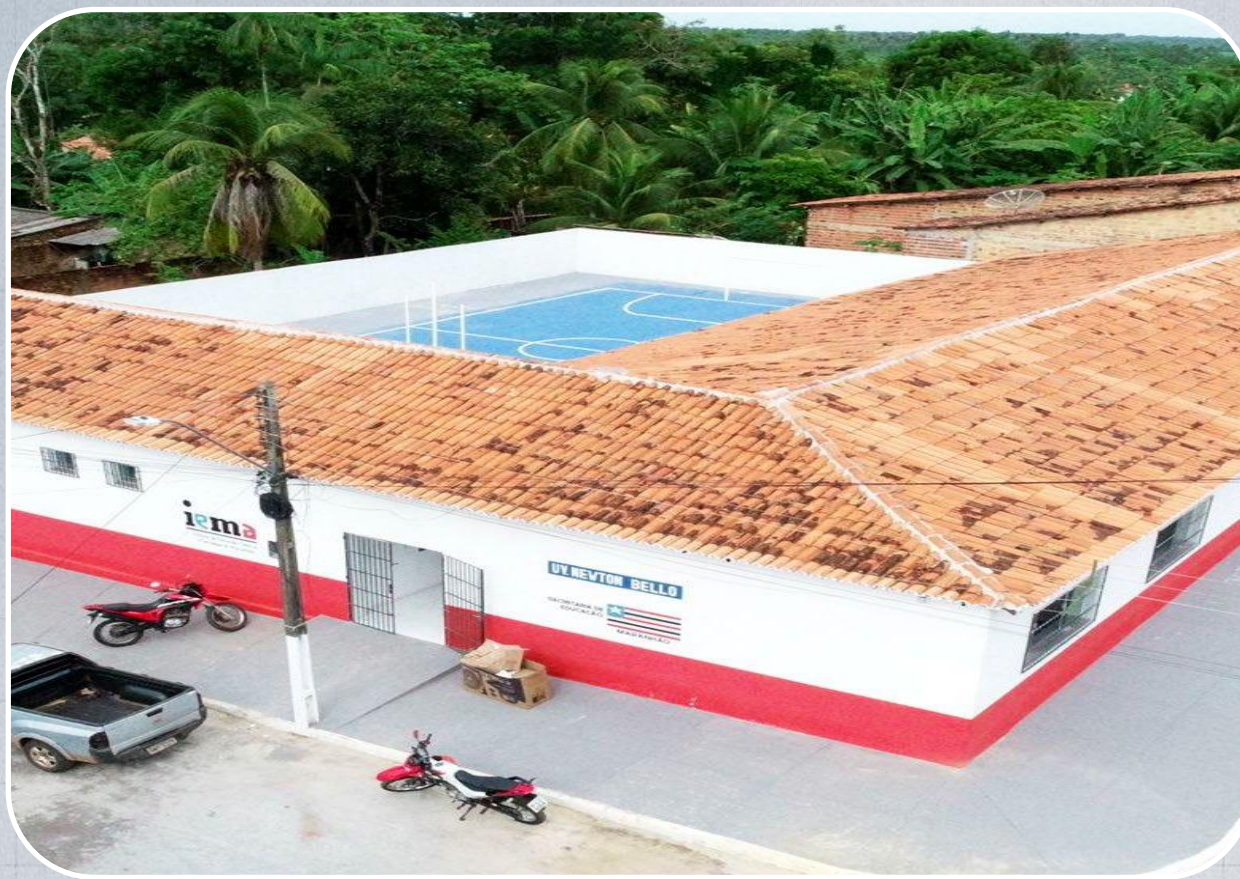
IEMA em Palmeirândia