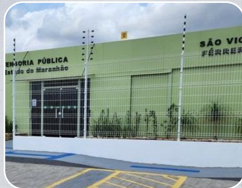
Econúcleo da DPE em São Vicente Férrer