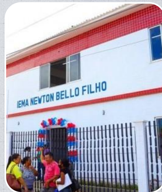
IEMA Newton Bello Filho em São Bento