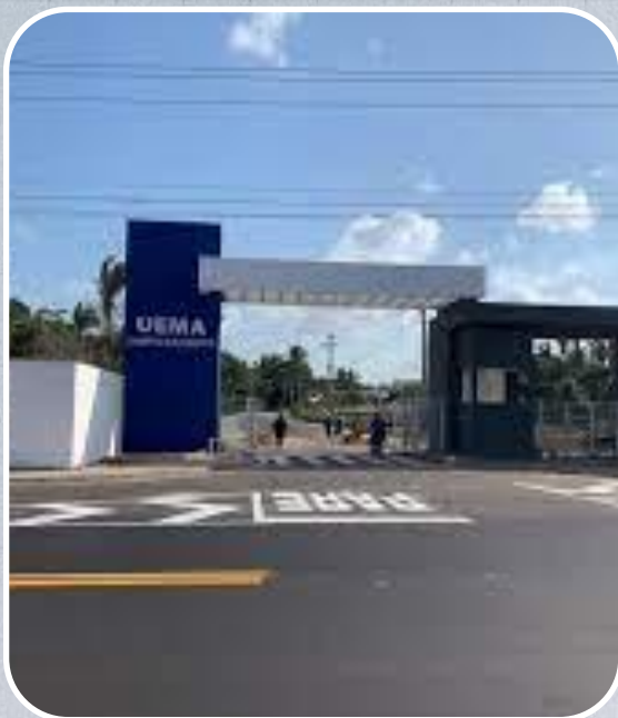
Campus da UEMA São Bento