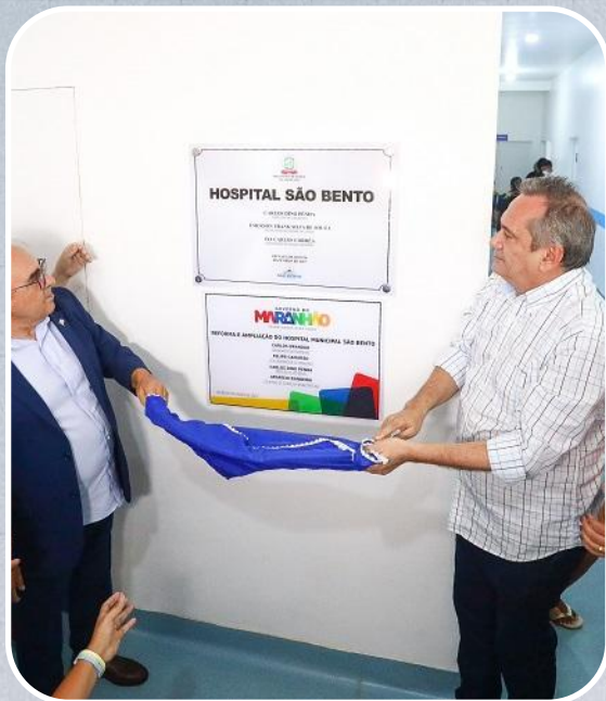
Reforma do Hospital de São Bento