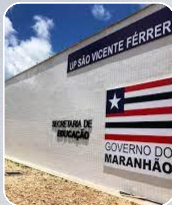
IEMA São Vicente Férrer