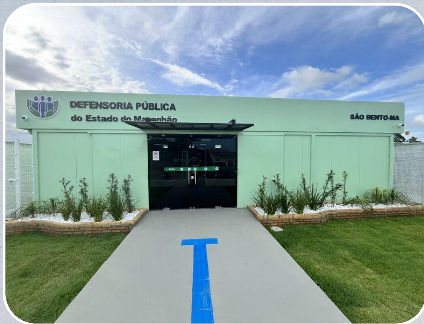
Econúcleo da DPE em São Bento