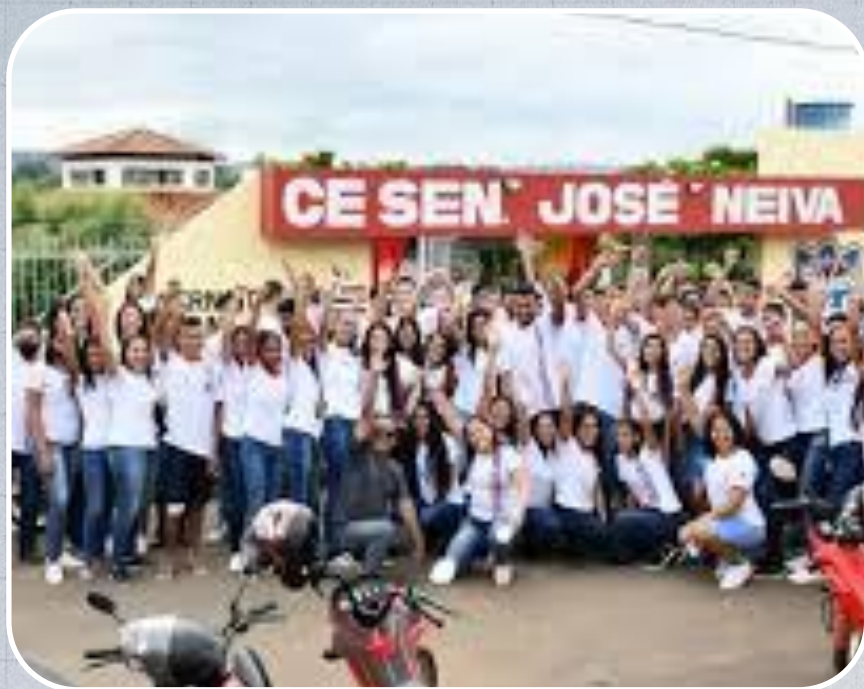
CE Senador José Neiva em Barão de Grajaú