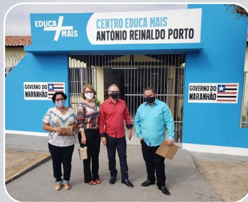
Centro Educa Mais em Passagem Franca