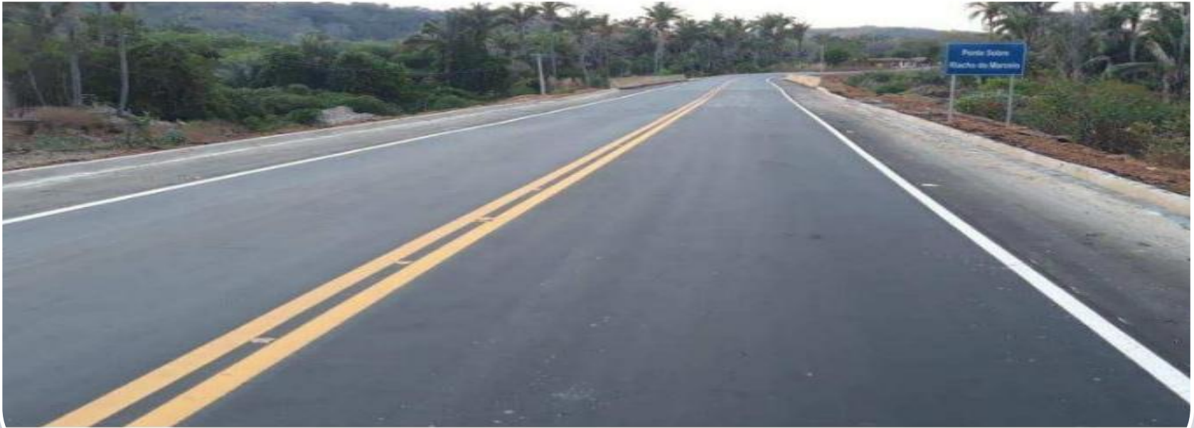
MA-278 já está pronta.

Segundo o SINFRA, a obra de 67km que liga Barão do Grajaú a São Francisco do Maranhão beneficiará cerca de 20 mil habitantes