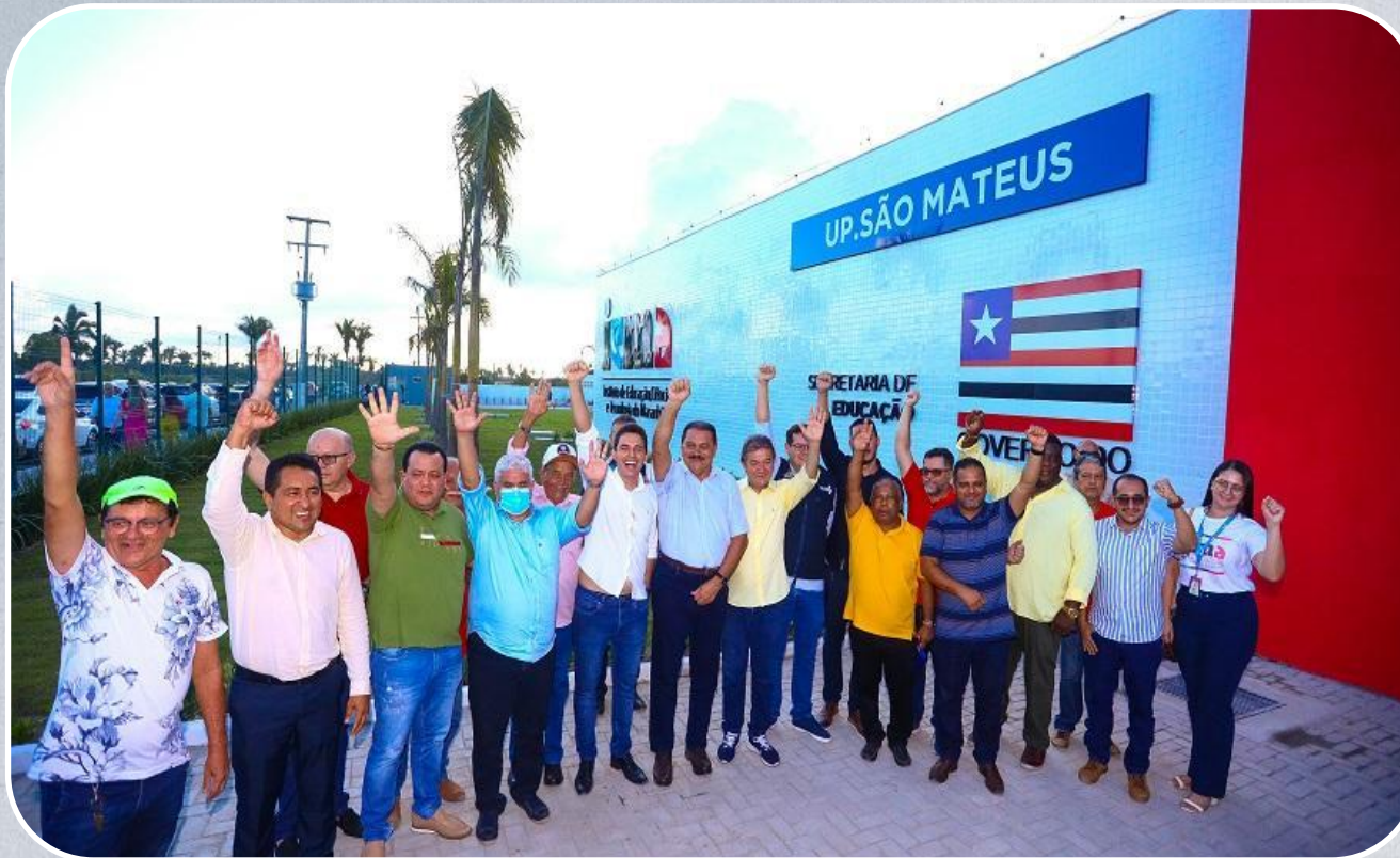
Unidade Plena do IEMA em São Mateus