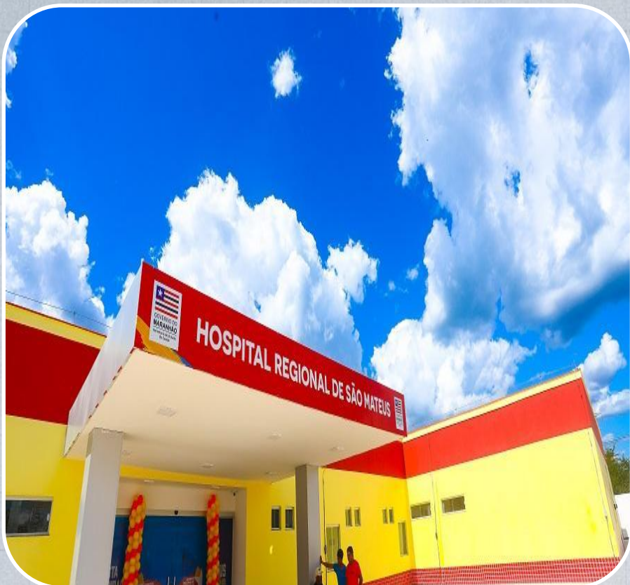
Hospital Regional de São Mateus