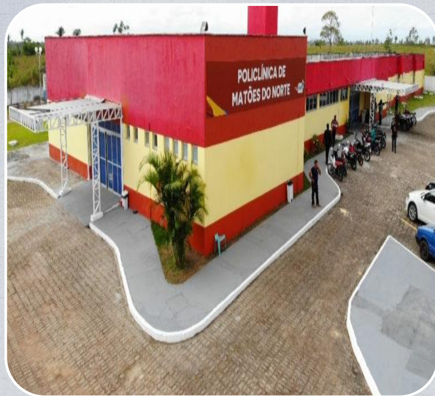
Policlínica de Matões do Norte