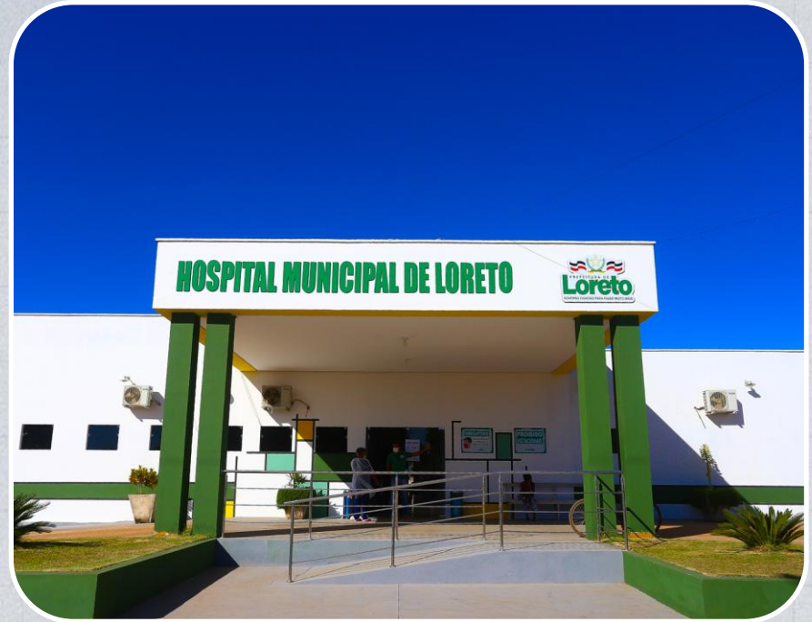
Reforma do Hospital Municipal de Loreto