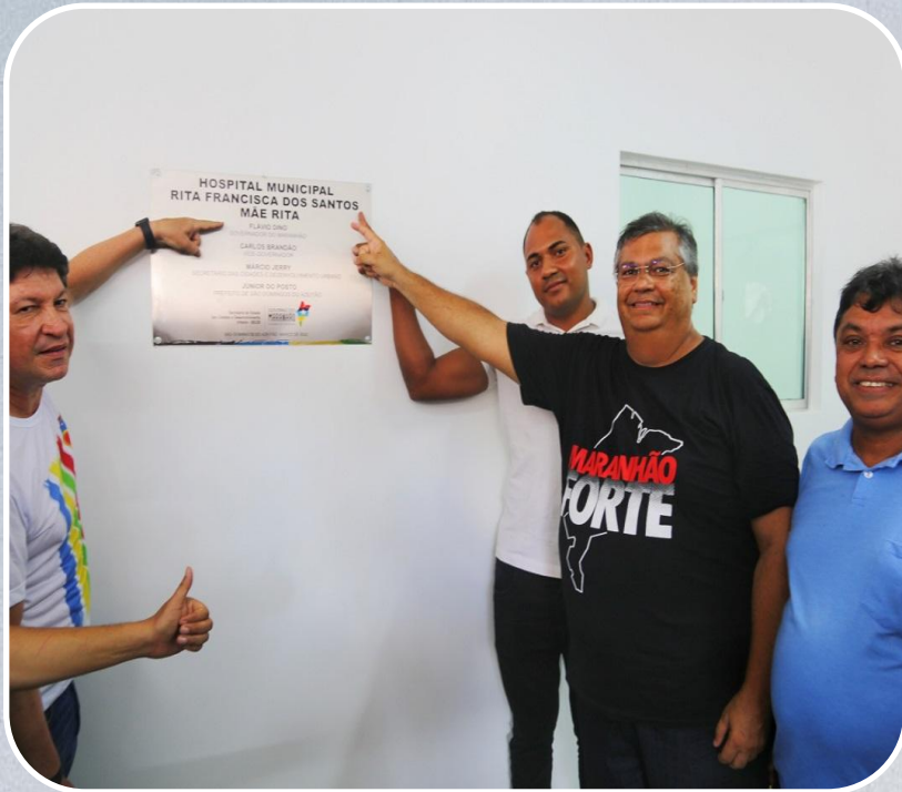
Reforma do Hospital Municipal Rita Francisca dos Santos em São Domingos do Azeitão