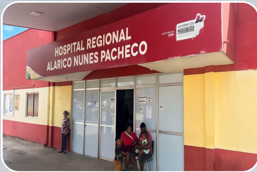
Hospital Regional Alarico Nunes Pacheco em Timon

Reforma, ampliação e equipagem de hospital.