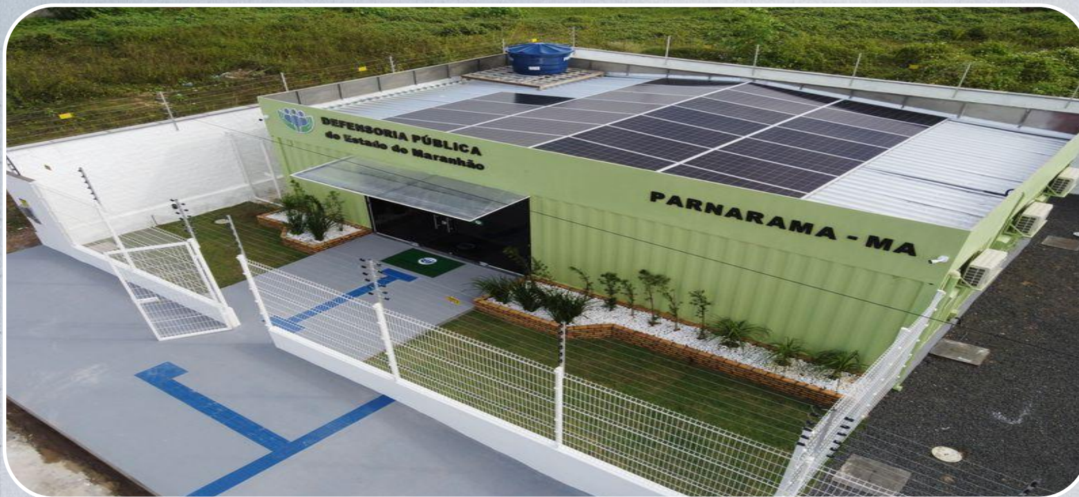
Econúcleo da DPE em Parnarama