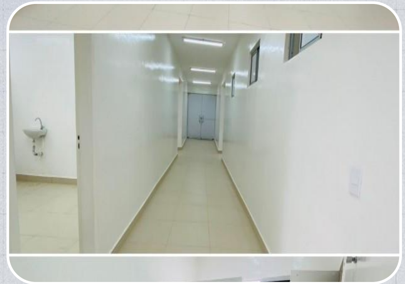
3ª Etapa Hospital Regional Alarico Nunes Pacheco em Timon - atenção às gestantes e aos recém-nascidos.