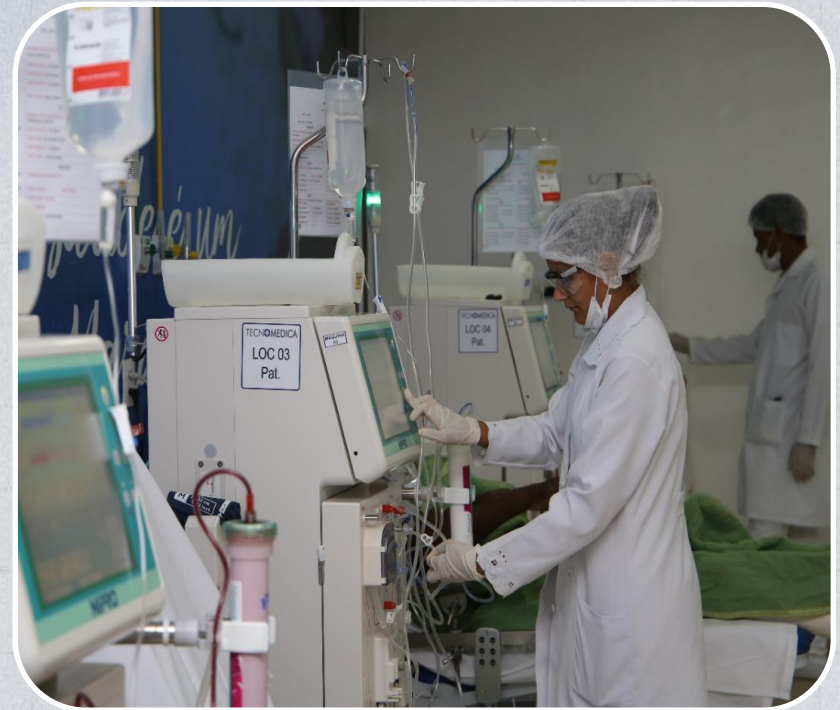
Centro de Hemodiálise de Chapadinha