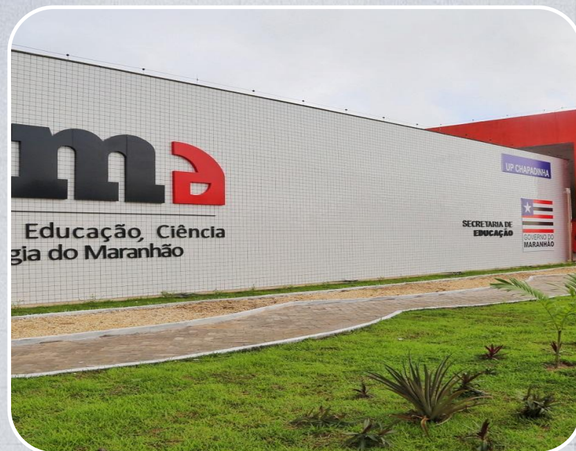
IEMA de Chapadinha