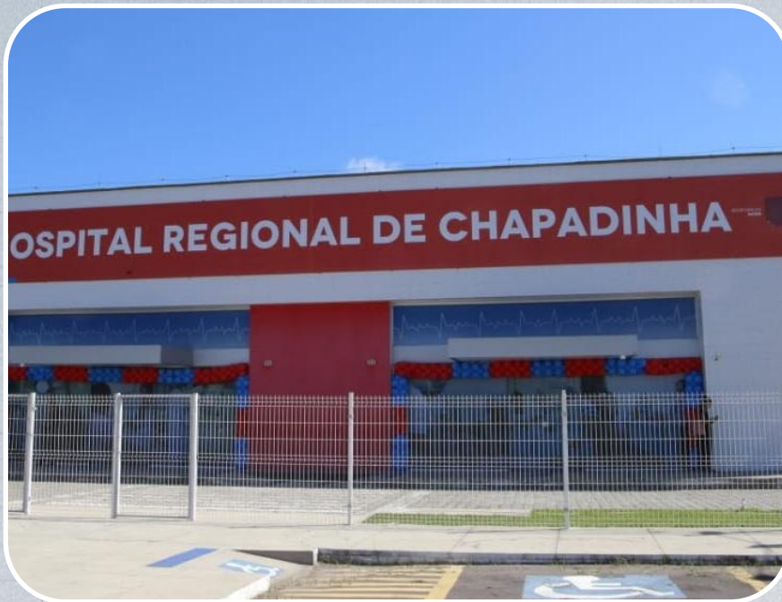
Hospital Regional de Chapadinha