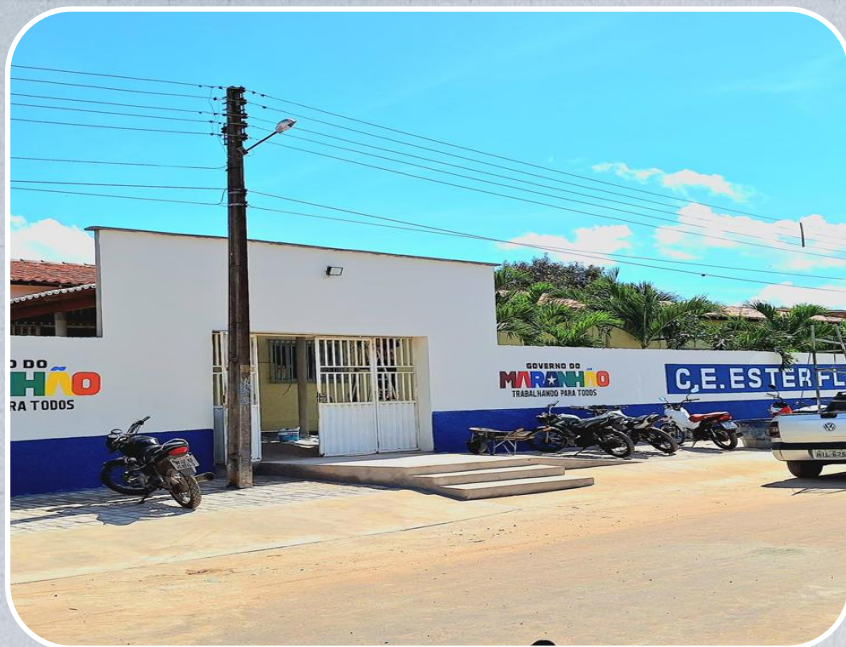
Reforma do Centro Escolar Ester Flora de Araújo em Urbano Santos