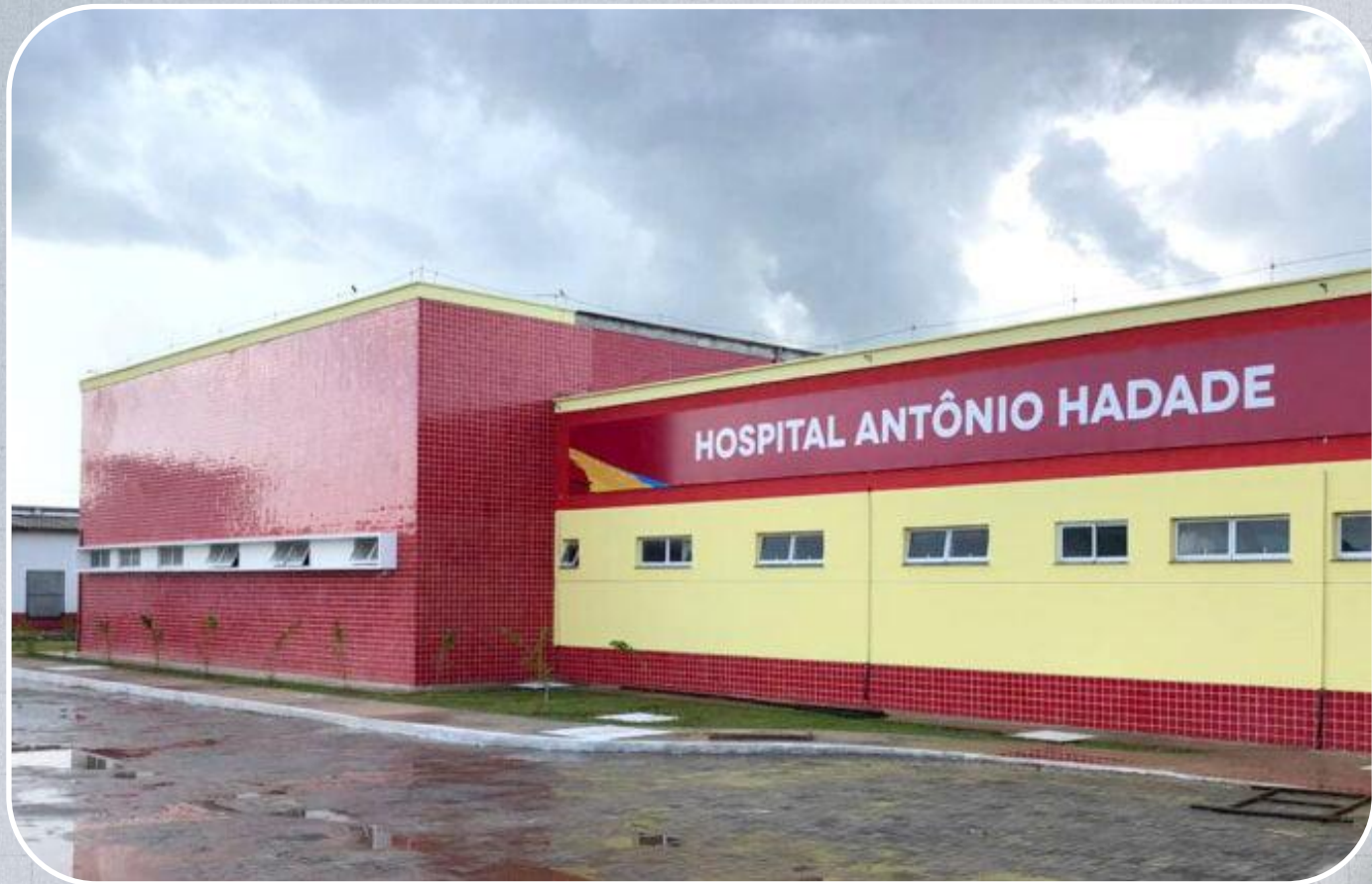
Hospital Antônio Hadade em Viana