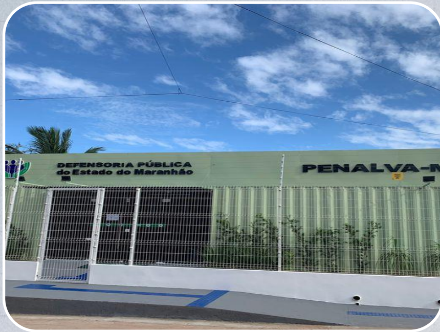
Econúcleo da DPE em Penalva