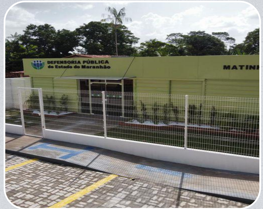
Econúcleo da DPE em Matinha