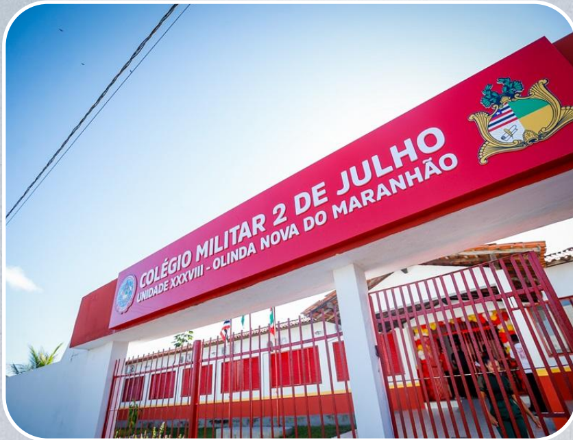
Colégio Militar 2 de Julho - Unidade XXXVIII em Nova Olinda do Maranhão