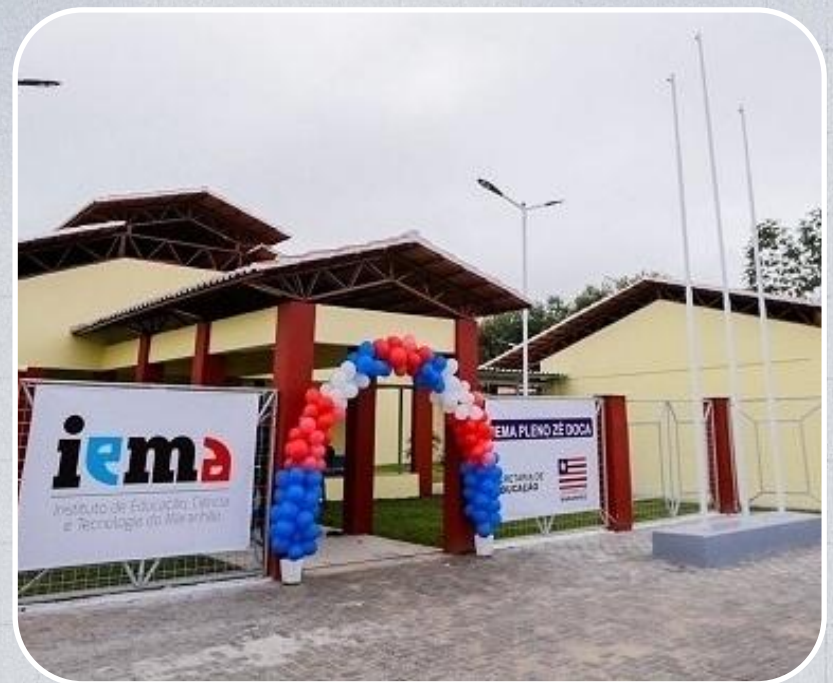
IEMA Pleno em Zé Doca