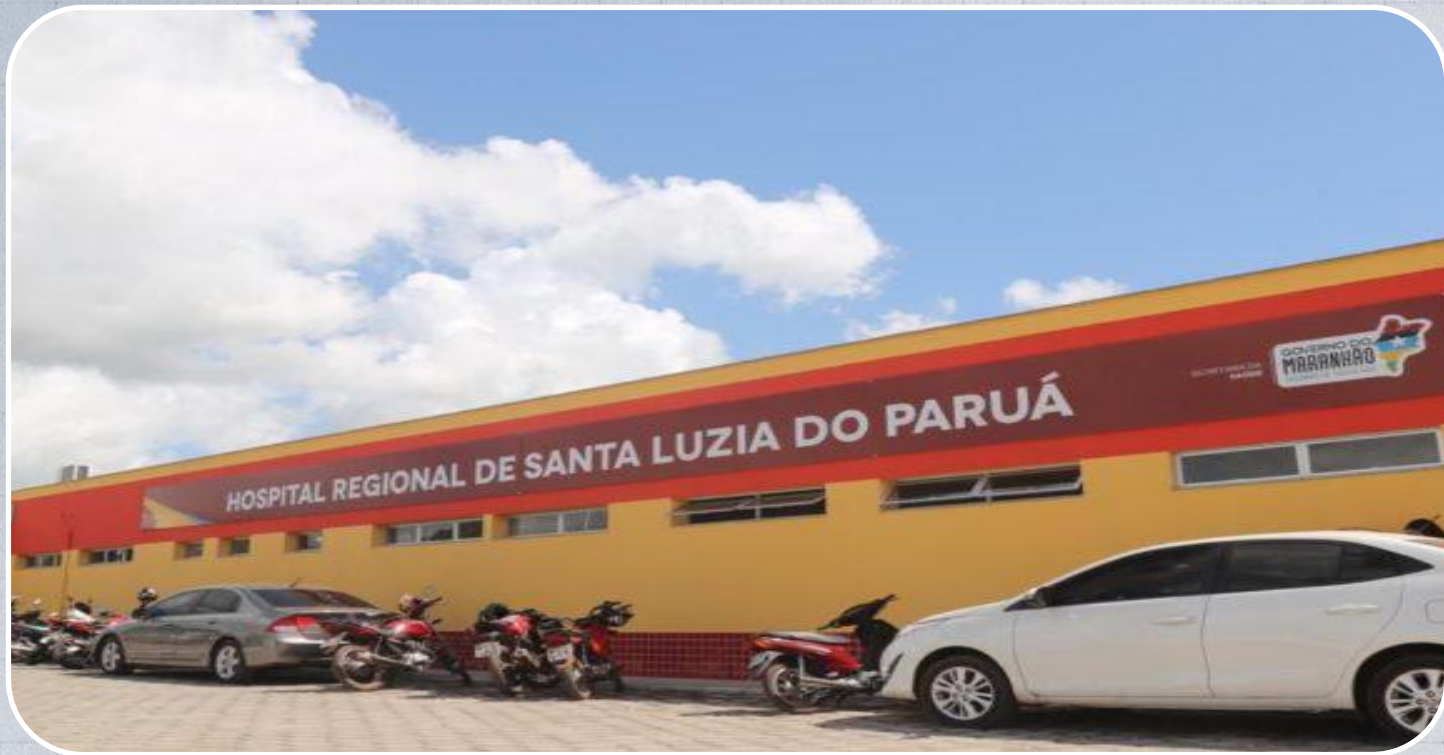
Hospital Regional de Santa Luzia do Paruá